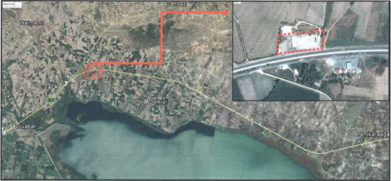
Plan Değişikliğine Konu Olan Alan

Nazım İmar Planı hazırlanan parsel tapu kayıtlarına göre 5.000 m 2 büyüklüğündedir.