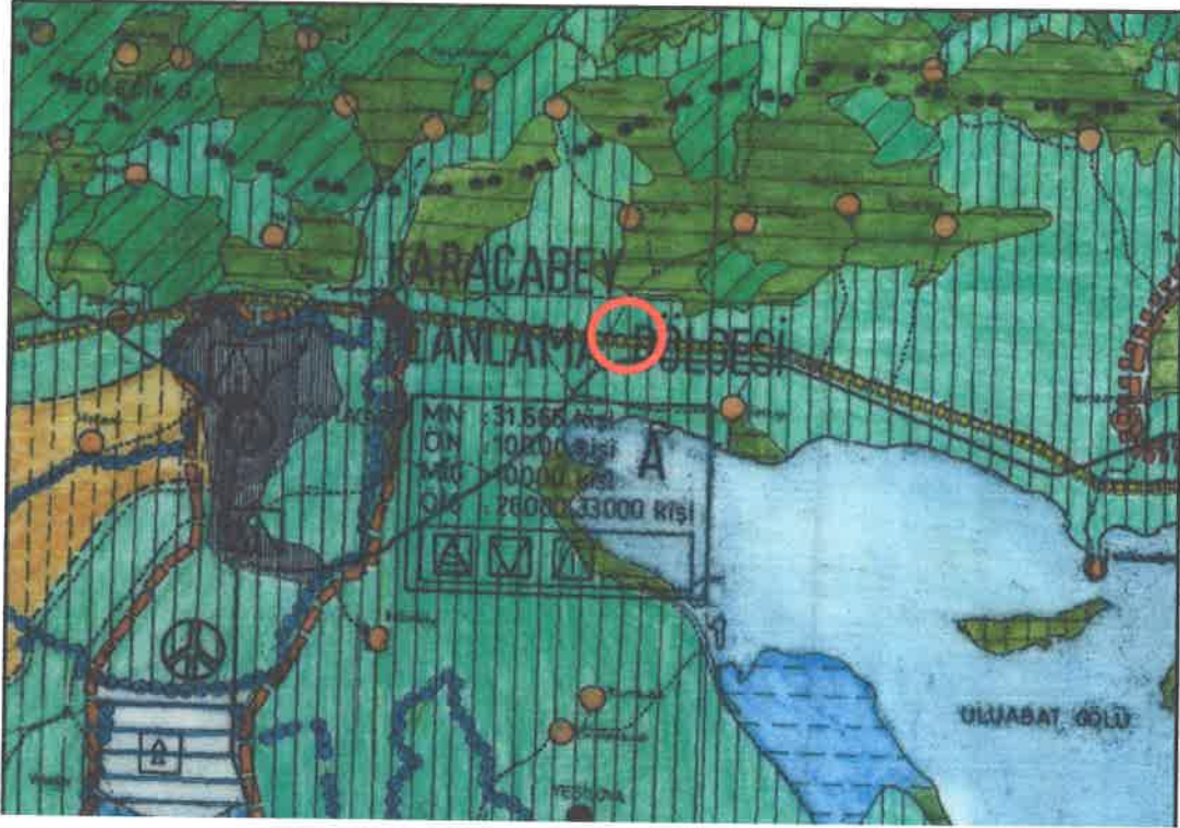
1/100.000 Ölçekli Çevre Düzeni Planı

Plan değişikliği hazırlanan 3144 parsel için hazırlanmış 1/5000 Ölçekli Nazım İmar Planına Esas Jeolojik ve Jeoteknik Etüd Raporu, Çevre ve Şehircilik İl Müdürlüğü'nce 26.09.2016 tarihinde onaylanmıştır. Parselin bulunduğu alan Jeolojik-Jeoteknik Etüd raporunda Önlemleri Alan 5.1 olarak tariflenmiştir. İnceleme alanında zeminin geneline bakıldığında kohezyonlu zeminin orta katı-katı ve çok katı kıvamda olduğu tespit edilmiştir.